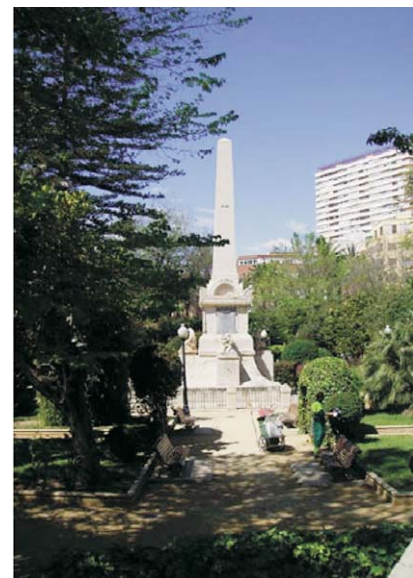
Panteón de Quijano. Alicante.

En 1854 sufrió Alicante una de sus terribles epidemias de cólera, tristemente famosa ésta por diezmar a la población, muriendo hasta el propio gobernador civil Trino González de Quijano cuya labor humanitaria alcanzó una repercusión nacional, erigiéndosele un monumental panteón que hoy perdura, como es bien sabido, junto a la plaza de toros. En 47 días de agosto y septiembre fallecieron 1.864 personas sobre una población de 10.000, parte de la cual había huido al campo. Una de aquellas víctimas sería la mujer de Lagier el cual también perdió a sus suegros, cuñados y sobrinos.