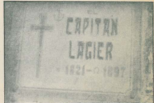
Tumba de Ramón Lagier, en el cementerio de Elche

Abortada por O'Donnell la insurrección de enero de 1866, comandada por Prim, Pierrad y Contreras, escribió Lagier al pri-