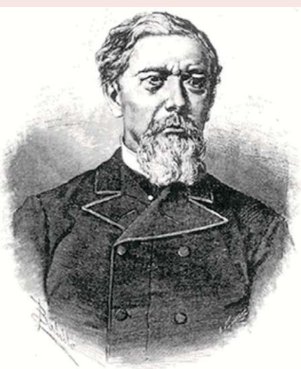
Antonio López y López. Marqués de Comillas.

Su valor ilimitado unido a su talante generoso y heroico, hicieron posible el que en 1859 el gobierno francés le concediera, por sus actos de salvamento y servicios a la humanidad, una medalla de plata con la efigie del emperador Napoleón III y la siguiente dedicatoria: "A Raymond Lagier, capitán de navío español de Alicante. Servicios a la marina mercante francesa 1859". En el diploma que se le acompañaba se hacía constar que la concesión se hacía por el socorro prestado al navío francés 'Victor Henriette' el 4 de diciembre de ese precitado año.