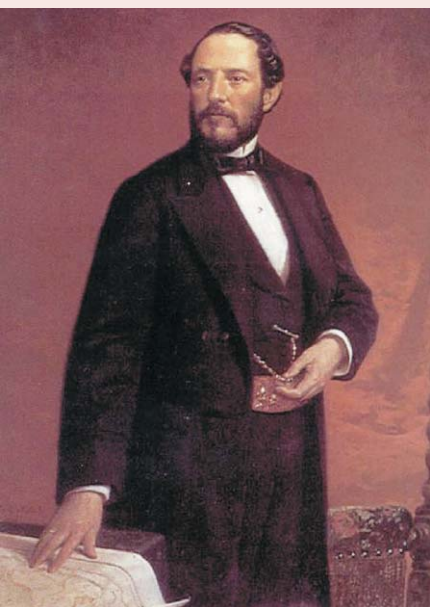
El general Prim.

Como ya apuntamos anteriormente, las hazañas de Lagier figuran descritas por Galdós en 'La de los tristes destinos', último de los Episodios Nacionales de la cuarta serie, tras 'Prim', donde narra las vicisitudes de la Revolución de 1868. Ese año publicó en Marsella su libro autobiográfico 'Algún miedo tuve' donde también incluye reflexiones políticas y filosóficas, llegando su fama a tal nivel, que le obligó a viajar por diferentes capitales como Madrid, Barcelona o Sevilla para impartir conferencias.