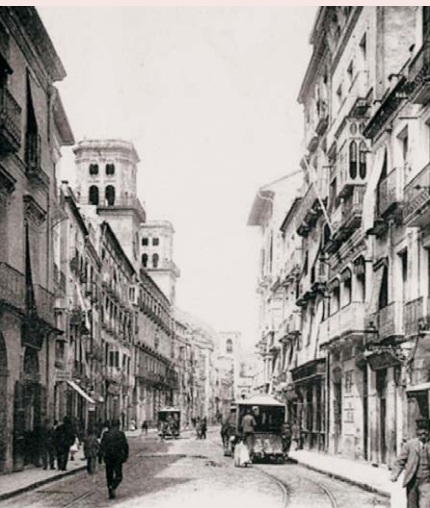
La calle Princesa, en Alicante.

También ha habido textos en los que se ha considerado a este personaje originario de Elche, ciudad con la que sí estuvo muy vinculado, cayendo en este error el mismísimo Benito Pérez Galdós cuando lo hace protagonista destacado en unos de sus Episodios Nacionales, tema del que hablaremos más adelante.